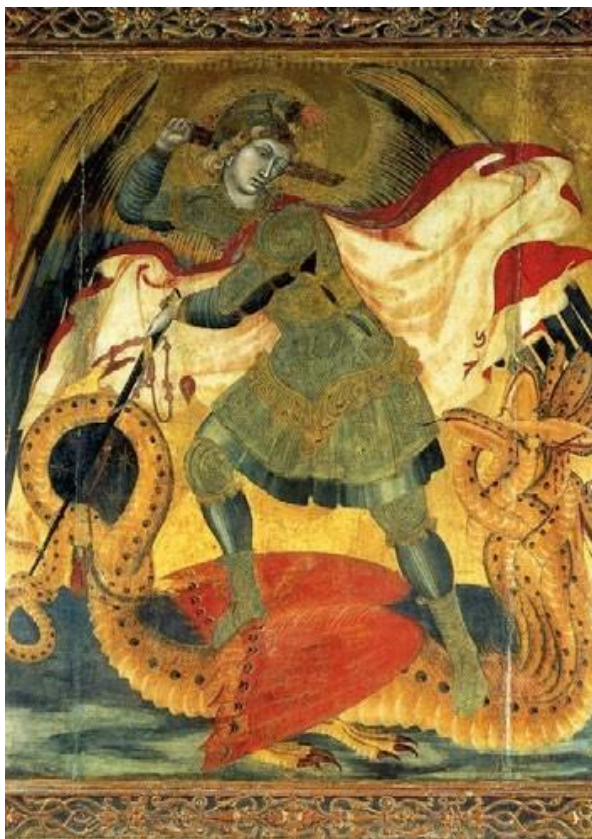
Михаил, Амброджо Лоренцетти

Преднамеренная, полностью осознанная, целенаправленная воля ко злу, воля принести вред ближнему, причинить ему боль, разрушить, уничтожить и получить от этого удовольствие - это азурическая деятельность. Садизм. - Азурические существа стремятся не только к сознательному слиянию человека с Землей, но и к его слиянию с чувственностью Земли. И это будет иметь совершенно иные последствия, нежели люциферическое зло и ариманическое зло. Люциферическое зло мы совершаем, так сказать, безразлично, небрежно, бездумно, эгоистично. Ариманическое зло: обманчиво и без совести. Азурическое зло: намеренно, по желанию, с удовольствием. И одно притягивает к себе другое: в тот момент, когда мы призываем Люцифера, появляется и Ариман, - а сегодня, в 20-ом столетии, за ним следуют и азурические существа. Их импульс приводит к колоссальному усилению, даже превышению ариманического зла. - А с другой стороны: в тот момент, когда мы призываем Аримана и его воинство, появляется и Люцифер.