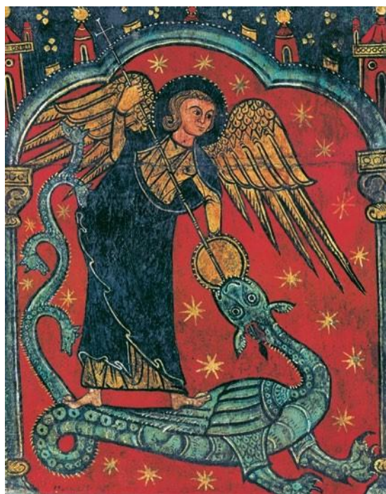
Михаил, романская живопись, XII столетие.

сущностного зла. Но надо понимать, что то, что сейчас раскрывается, вероятно, лишь верхушка айсберга. Человечеству теперь придётся столкнуться с этим лицом к лицу и выбраться из царящей апатии и смирения перед существующими властными структурами, но прежде всего из ошибочного представления о том, что ничего сделать нельзя.