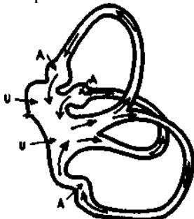
Рис. Схематическое представление лабиринта. Стрелки указывают на направление потока эндолимфы

ориентировки открывает нам врата в мир. Посредством его мы чувствуем себя вписанными в окружающий мир. «Мы воспринимаем отношение нашего внутреннего существа к внешнему миру, внутри которого мы чувствуем себя в равновесии». 14