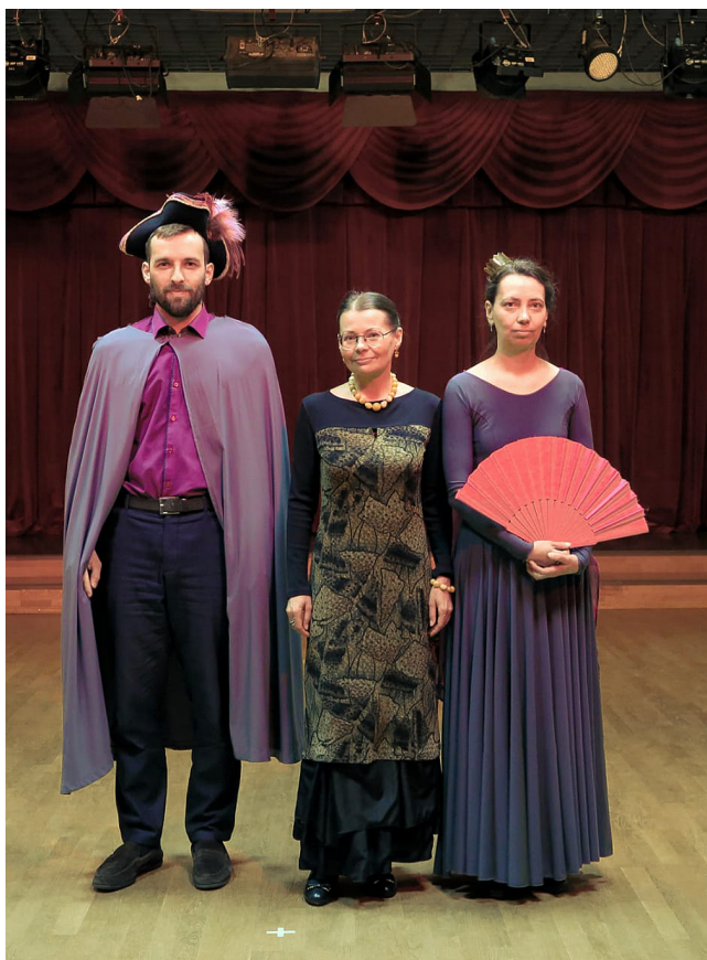
Школа искусства формирования речи и драматического искусства им. Ильи Дувана

5 апреля 2021 в Петербурге студенты нового набора начали свой образовательный путь в школах сообщества антропософских искусств: