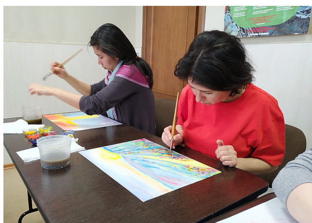
Школа изобразительного искусства им. Максимилиана Волошина

Идея образовательного процесса, где школы искусств имеют общий учебный план, родилась уже давно. Сейчас сложились условия, которые позволяют в полной мере это осуществить: дать возможность студентам знакомиться и переживать разные искусства и через это открывать новые стороны в том направлении, которое студент выбрал для себя как основное. Студенты школ вместе идут по пути ученичества, делятся друг с другом своими переживаниями, создают единый социальный организм.