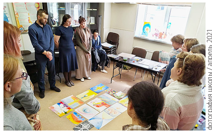
фотография школы / апрель 2021