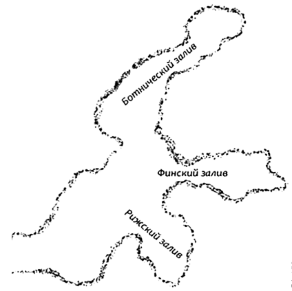
Рисунок Балтийского моря из лекции