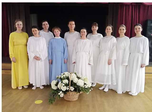
Школа эвритмии им. Андрея Белого