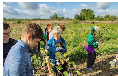
В Ставотино с волонтерами

В нашем распоряжении имеется 5 гектаров земли и каменное здание бывшего клуба. Место площадью 150 м 2 , где отмечали праздники 1 Мая, Новый год, смотрели кинофильмы, проводили танцевальные вечера и ставили спектакли. С помощью наших друзей из Германии, а также частных лиц, мы построили два гостевых дома, баню и душевые кабины. На участке есть скважина с чистой водой. В доме проведена горячая вода. Вместе