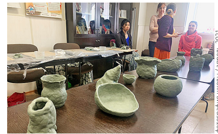
фотография школы / апрель 2021